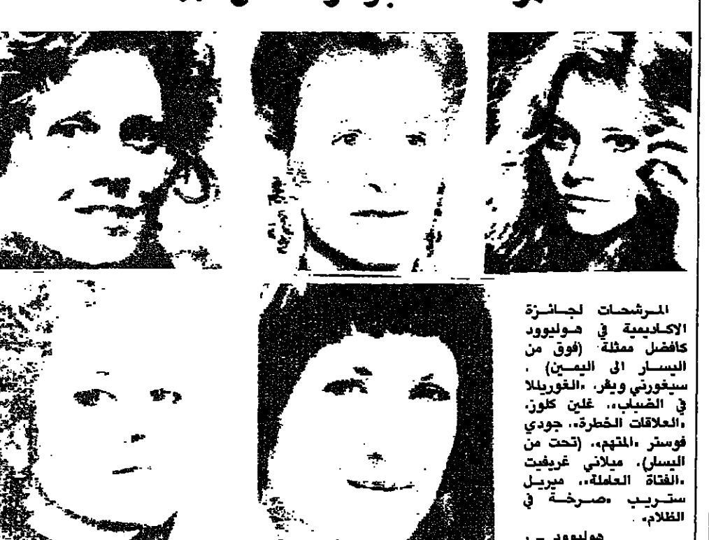
المرشحات لجائزة الاكاديمية في هوليوود كافضل ممثلة (فوق من اليسار إلى اليمين): سيغورني ويفر، الغوريلا في الضباب، غلين كلون، العلاقات الخطرة، جودي فوستر، المقيم، تحت من اليسار، ميلاني غريفيت الفتاة العالمة، ميريل ستريب، صرخة في الظلام، هوليوود - ١ ف ب